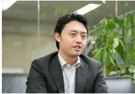
東京大学大学院 特任准教授

日時 平成29年11月14日(水) 14:00~15:00 場所 中央合同庁舎2号館(地下2階) 講堂